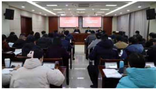
2月9日上午,学院在锦绣校区第三会议室召开2022年度二级党组织书记抓党建述职评议考核会