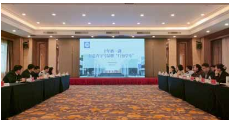
学院在全省直属高校共青团工作推进会上作典型交流发言

本报讯 2月8日,全省直属高校共青团工作推进会暨2022年度述职评议会在合肥召开,团省委书记陈明生出席并讲话。我院团委参加会议并做典型交流发言。