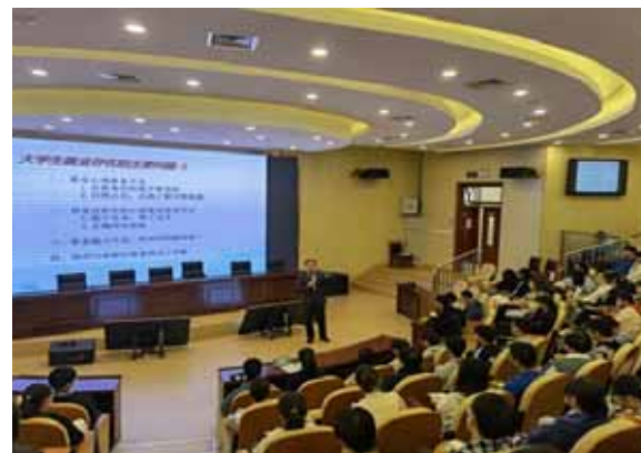
学院开展考研、考公等讲座20余场

学院就业指导部门深入15个二级学院和3所联合培养学校开展就业创业工作专题调研,召开座谈会,查找问题,分析原因,推动解决。就业创业工作网转发各级政府、有关部门鼓励支持就业创业政策10余条。针对毕业生开展问卷调查,问卷参与率达75%。举办就业促进周和“百日冲刺”系列活动13项。根据毕业生不同需求,邀请校内外导师和专家开展考研、考公、考编、应征入伍等讲座20余场。组织毕业生收看教育部24365就业公益直播课28场。共有543名毕业生考取研究生,发放考研奖励近11万元。认真做好基层就业项目信息发布和报名等工作,4人考取边疆基层项目,人数再创新高。细致做好毕业生派遣工作,平稳顺利完成2022届5704名毕业生的生源信息确认、报到证打印签发、档案邮寄等工作。