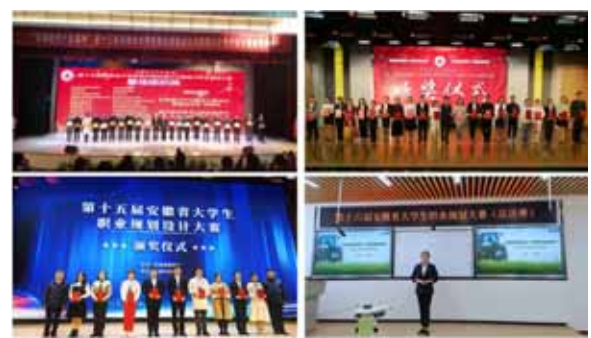
职业规划和创业类赛事获奖频频

学院高度重视学生职业规划和创业类赛事,以赛促学、以赛促创,每年定期举办职业规划设计暨创业大赛,3月发布赛事通知,组织各二级学院开展选拔赛;5月举办校内赛,择优推荐参加省半决赛和总决赛。在准备省赛的过程中,邀请校内外就业创业导师,从职业规划书设计、PPT制作、视频拍摄、选手现场展示、