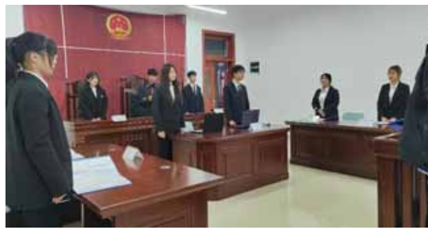
学院举办第十三届模拟法庭活动

本报讯 模拟法庭进校园,知法守法我先行。在全国第九个宪法日到来之际,12月3日下午,主题为“抵制校园诈骗,弘扬法治精神”的学院第九届模拟法庭活动在滨湖校区铭传楼“开庭”。院团委、马克思主义学院有关负责人和教师、学生代表共200余人参加活动。活动通过腾讯会议同步直播。