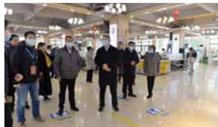
检查组一行到竹园食堂走访检查